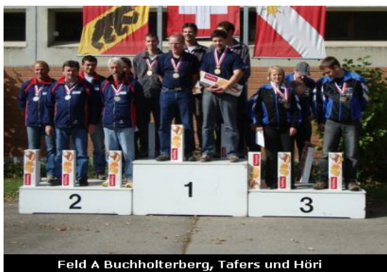
Feld A Buchholterberg, Tafers und Höri