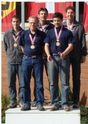
Die Sieger im Feld A Tafers

Bei guten Verhältnissen konnte die erste Runde vom Final ohne Probleme abgewickelt werden. Von den meistgenannten Favoriten Höri, Tafers, Buchholterberg, und Schweizermeister Aarau waren nach der ersten Runde mit Ausnahme von Aarau die drei erstgenannten Gruppen innerhalb von vier Punkten, Höri schoss das Höchstresultat mit 489 Punkten. Bemerkenswert ist, dass die ersten neun Gruppen alle über 480 Punkte erreichten. In dieser Umgebung hängen die Trauben sehr hoch.